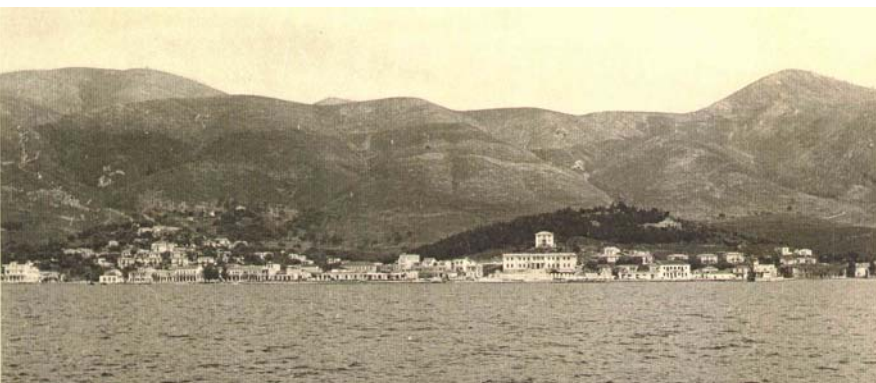
Εικ. 4. Το παραλιακό μέτωπο της πόλης το 1952. Το δάσος αρχίζει σιγά σιγά να κρύβει τα ερείπια του ενετικού κάστρου. Έχει αποπερατωθεί ο δεύτερος όροφος του κτηρίου της Νομαρχίας, ενώ πίσω διακρίνεται το κτήριο του Δασαρχείου.