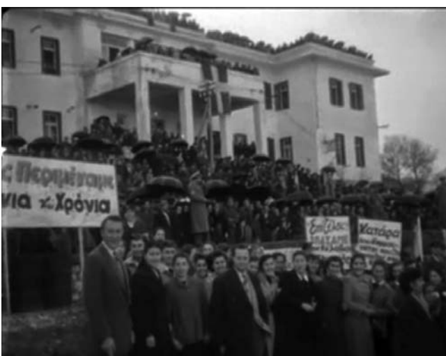
Εικ. 7. Φεβρουάριος του 1954. Υποδοχή πολιτικών προσφύγων του Εμφυλίου έξω από το κτήριο της Νομαρχίας.