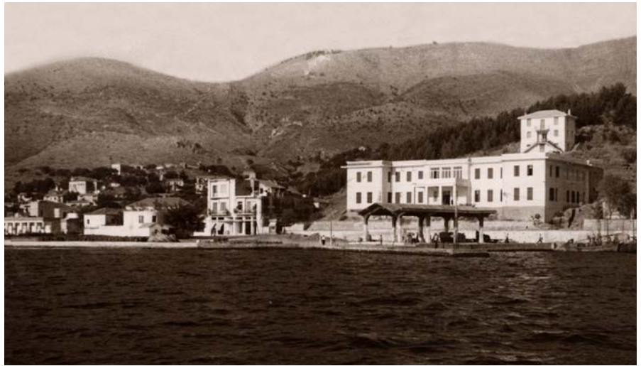
Εικ. 1. Το κτήριο της Νομαρχίας και μπροστά οι εγκαταστάσεις του λιμανιού. Πίσω από τη Νομαρχία διακρίνεται το κτήριο του Δασαρχείου.