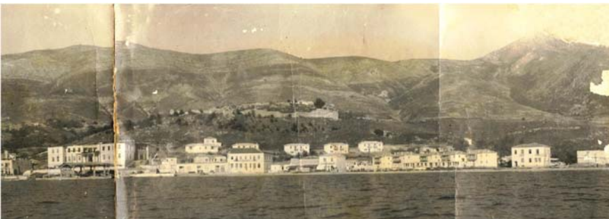
Εικ. 3. Η Ηγουμενίτσα από το Αγιονήσι. Στην κορυφή δεσπόζει το ενετικό κάστρο. Στα αριστερά το κτήριο της Νομαρχίας. Η ανέγερση του δεύτερου ορόφου έχει ξεκινήσει αλλά δεν έχει ολοκληρωθεί. Πριν τη δεκαετία του 1940.

Την περίοδο του μεσοπολέμου η αξιοποίηση του λιμανιού και η διάνοιξη του δρόμου για τα Ιωάννινα (1933) δίνουν διέξοδο στην απομόνωση, αναβαθμίζοντας τον ρόλο της Ηγουμενίτσας σε βασικό οικονομικό κέντρο της περιοχής. Ακολουθεί το 1936 η συγκρότηση της Θεσπρωτίας σε ανεξάρτητο νομό για λόγους κυρίως εθνικούς και πολιτικούς και η ανάδειξη της Ηγουμενίτσας σε πρωτεύουσα. Η στελέχωση της διοίκησης με υπαλλήλους επιβάλλει εκ νέου σχεδιασμό για την οργάνωση των υποδομών της νέας πρωτεύουσας, εγκαινιάζοντας μία φάση εκτεταμένης οικοδόμησης: κτήρια δημοσίων υπηρεσιών, επέκταση του Διοικητηρίου, δικαστήρια και κατοικίες των αρχών. Η Ηγουμενίτσα πλέον μεταβάλλεται και σε διοικητικό κέντρο, απορροφώντας όχι μόνο προϊόντα αλλά και ανθρώπινο δυναμικό από τα γύρω χωριά.