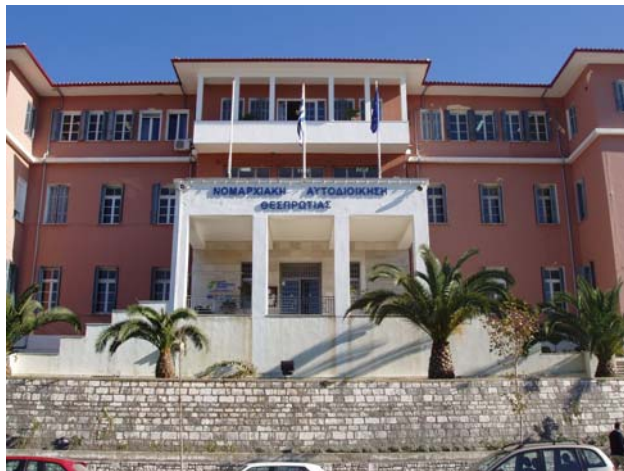
Εικ. 5, 6. Αριστερά. Το κτήριο της Νομαρχίας σε φωτογραφία του Σπύρου Μελετζή. Στην κορυφή διακρίνεται το σύμβολο της χούντας, ο φοίνικας. Δεξιά. Το Νομαρχιακό Μέγαρο πριν την τελευταία ανακαίνιση των εξωτερικών όψεων.