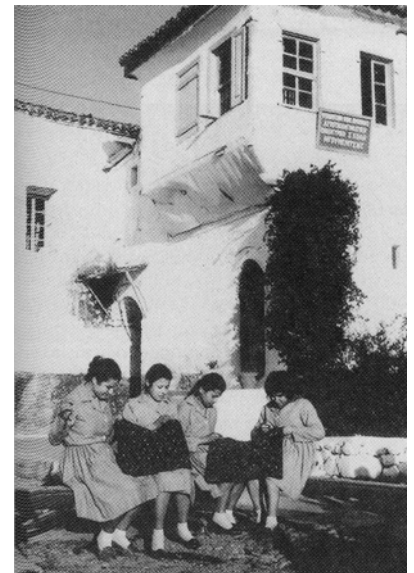
Εικ. 2. Το κτήριο της Οικοκυρικής Σχολής.

Η υιοθέτηση νέων συνηθειών συνυπήρξε, ωστόσο, με την επιβίωση στοιχείων της νομαδικής παράδοσης, όπως η ενασχόληση με την κτηνοτροφία τουλάχιστον μέχρι τη δεκαετία του '80, οι στενοί δεσμοί μεταξύ των μελών της οικογένειας που αντανακλάται στη συστέγαση των τεσσάρων οικογενειών