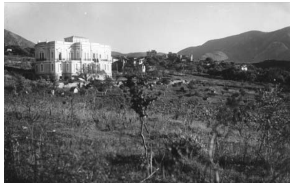
Εικ. 9. Το μέγαρο Πιτούλη λίγα χρόνια μετά την ανέγερσή του. Φωτ. Σπύρος Μελετζής, 1937.

Ένας μεγάλος κήπος, σαράντα περίπου στρεμμάτων, με αμυγδαλιές και οπωροφόρα δέντρα, πολλά από τα οποία ήταν σπάνια για την εποχή, όπως λοτομηλιές, τζιτζιφιές, δαμασκηνιές, αλλά και πορτοκαλιές, λεμονιές, μανταρινιές, καρυδιές και φουντουκιές περιέβαλε το σπίτι. Τέσσερα πηγάδια και μία πέτρινη βρύση στη μέση του κήπου εξασφάλιζαν τις ανάγκες ύδρευσης της οικογένειας. Σήμερα ο κήπος αυτός έχει περιοριστεί σε μία έκταση περίπου τριών στρεμμάτων, καθώς διασχίζεται από κεντρικές οδούς και μικρότερους δρόμους που προέβλεπαν τα διάφορα σχέδια ανάπτυξης της πόλης της Ηγουμενίτσας (1953, 1957, 1964, 1997) και την ανέγερση πολυκατοικιών στα γύρω οικοδομικά τετράγωνα.