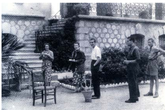
Εικ. 10. Το τέλος του εμφυλίου βρίσκει την Ηγουμενίτσα κατεστραμμένη. Νορβηγοί γιατροί, εκπρόσωποι του Ερυθρού Σταυρού, έρχονται για εμβολιασμούς στη Θεσπρωτία. Το μέγαρο ανοίγει τις πόρτες φιλοξενίας, όπως έκανε το 1936 για τους δημόσιους λειτουργούς, όταν η Ηγουμενίτσα έγινε πρωτεύουσα νομού, αλλά και το 1946, όταν ιδρύθηκε στην πόλη το πρωτοδικείο.

Η έναρξη του Β΄ Παγκοσμίου Πολέμου σημαδεύει τραγικά το αρχοντικό και τους ενοίκους. Οι Ιταλοί μετατρέπουν το κτήριο σε νοσοκομείο, ενώ η οικογένεια εγκαταλείπει την πόλη. Το σπίτι υφίσταται τις συνέπειες που προκάλεσε η ανομία των γεγονότων που ακολούθησαν. Σώζεται εξωτερικά, ενώ λεηλατείται εσωτερικά. Στον εμφύλιο χρησιμοποιείται ως κατάλυμα από αντάρτικα σώματα. Μετά τον πόλεμο παραχωρείται και πάλι για φιλοξενία δημόσιων λειτουργών.