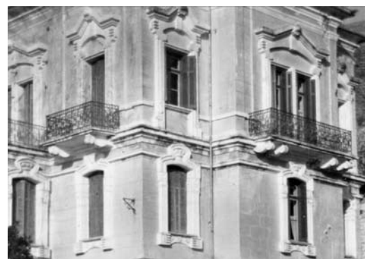
Εικ. 7. Λεπτομέρειες του γύψινου διακόσμου.

Δύο κυκλικές πέτρινες σκάλες οδηγούν στο πρόπυλο του πρώτου ορόφου. Εδώ πέντε κίονες που φέρουν ιωνικά κιονόκρανα αντιστοιχούν σε ισάριθμους πεσσούς που στηρίζουν τοξοστοιχία, μπροστά από τις δύο κεντρικές, δίδυμες εισόδους, του κτηρίου. Εκατέρωθεν των δύο εισόδων σχηματίζονται τυφλές κόγχες. Δύο εξώστες με κυκλικές γωνίες διαμορφώνονται συμμετρικά στον δεύτερο όροφο, ενώ εντυπωσιακά είναι τα γύψινα περβάζια και τα στρογγυλά στηθαία, ολόγυρα από κάθε όροφο.