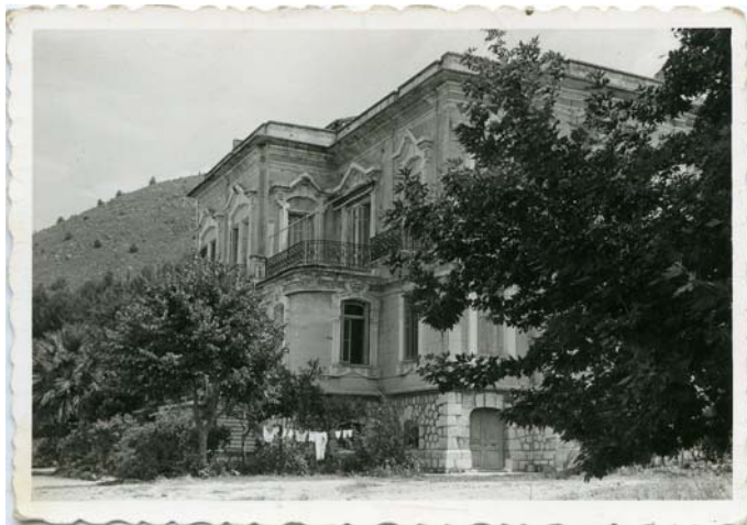
Εικ. 5. Οικία Πιτούλη, Σεπτέμβριος 1977.

εναλλαγή των μορφολογικών στοιχείων ανά όροφο. Είναι πιθανόν το κτήριο να ακολουθεί πρότυπα σχέδια από εκδόσεις για αρχιτέκτονες και εργολάβους που κυκλοφορούσαν από τις αρχές του 19 ου αιώνα. Σε σχετική αγγλόγλωσση έκδοση του 1855 περιλαμβάνονται κατόψεις διπλοκατοικιών που έχουν κοινά στοιχεία με την οικία Πιτούλη.