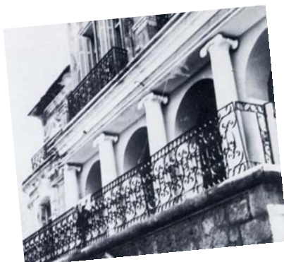
Εικ. 8. Λεπτομέρεια από την τοξοστοιχία της εισόδου.