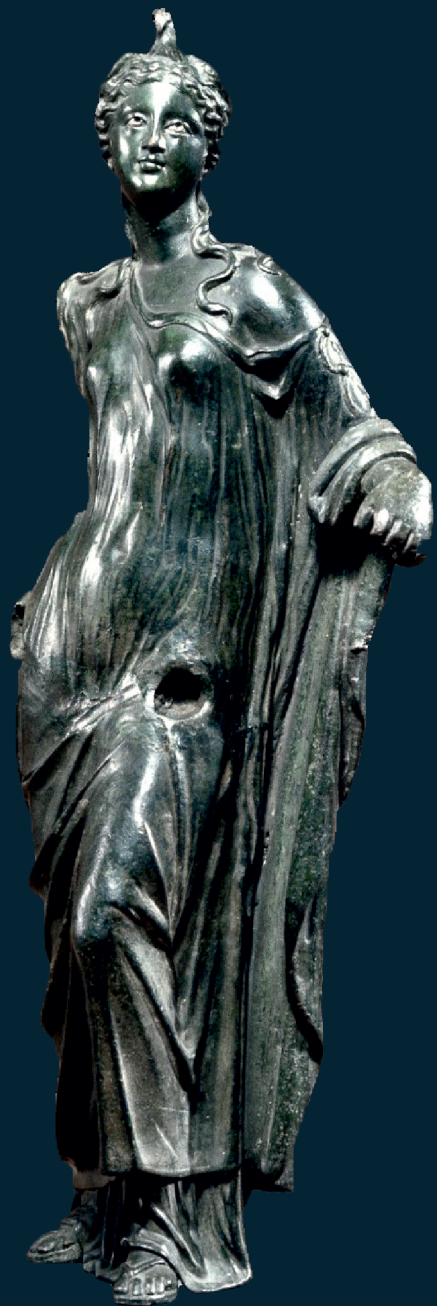
Χάλκινο αγαλματίδιο Διώνης ή Αφροδίτης 2 ος αι. μ.Χ. Προέλευση: Φωτική, Παραμυθιά Θεσπρωτίας Λονδίνο, Βρετανικό Μουσείο, αρ. κατ. 1824.0428.1