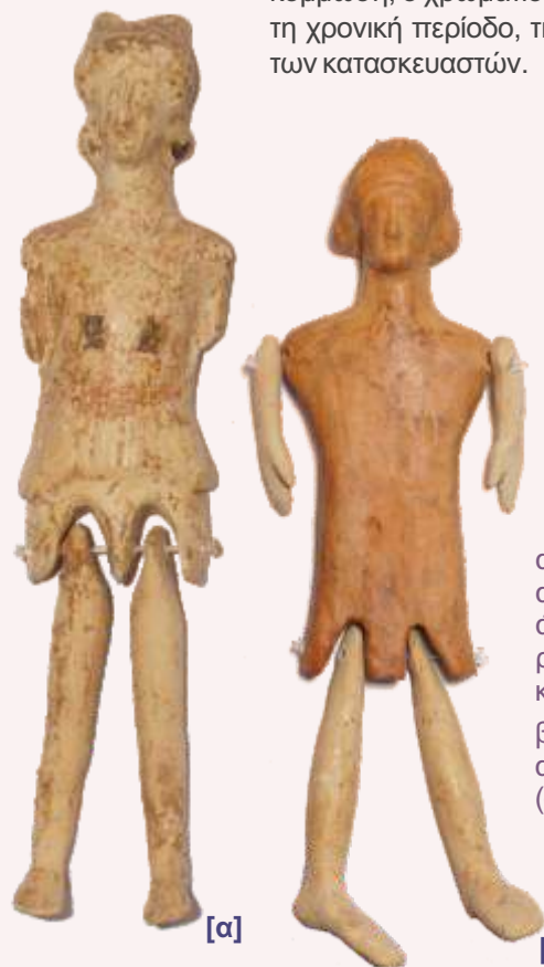
α. Πήλινη πλαγγόνα-νευρόσπαστο ανδρικής μορφής, ελλίπης ως προς τα άνω άκρα, 5ος αι. π.Χ. Για την απόδοση των ρούχων έχει χρησιμοποιηθεί λευκό, ερυθρό και μελανό χρώμα (αρ. κατ. 10053)

Οι πλαγγόνες αρχικά ήταν αυτοσχέδιες και κατασκευάζονταν με πρόχειρα και φθηνά υλικά. Αργότερα εμφανίζονται εξειδικευμένα εργαστήρια και πλέον οι πρώτες αυτές χειροποίητες κούκλες αντικαθίστανται από πιο επιμελημένες, που κατασκευάζει ο κοροπλάστης με τη βοήθεια μήτρας (καλουπιού). Ανάλογα με τον τρόπο κατασκευής, τη χρονική περίοδο και την οικονομική ευμάρεια του πελάτη, χρησιμοποιήθηκαν διάφορα υλικά: κυρίως πηλός αλλά και ξύλο, οστό, για την πλειοψηφία των πελατών, πιο εκλεπτυσμένα υλικά, όπως το ελεφαντόδοντο, το κερί, το ύφασμα, ο λίθος για εύπορους πελάτες. Οι τεχνικές κατασκευής και τα ειδικά χαρακτηριστικά του παιχνιδιού, όπως τα ρούχα, η κόμμωση, ο χρωματισμός κλπ., διαφοροποιούνται ανάλογα με τη χρονική περίοδο, τη μόδα της εποχής και την επιδεξιότητα των κατασκευαστών.