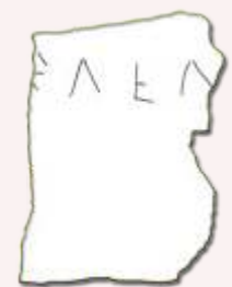
[---έν] Έλέα [ι---]

Από το Υπουργείο Πολιτισμού και Αθλητισμού έχει υποβληθεί υποψηφιότητα για την εγγραφή του συνόλου των μολύβδινων ελασμάτων της Δωδώνης στον Κατάλογο της UNESCO «Μνήμη του Κόσμου».